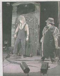
La Cie Pile ou Versa pénètre les coulisses du cirque avec ses mythes et mystères.

Dans un univers de film muet, en noir et blanc, la "bande son" est jouée en direct au piano ainsi que les bruitages pour accompagner et intensifier les dialogues des comédiens. Jusqu'où peut-on aller par amour pour ne pas perdre l'être aimé ? C'est une véritable tragédie digne de